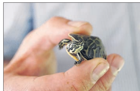
Einen Tag nach dem Kauf abgegeben.